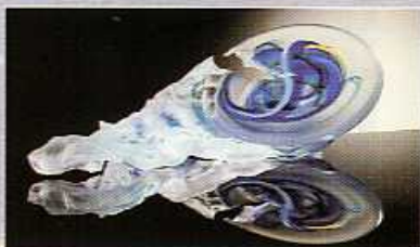
Œuvre M. Klein